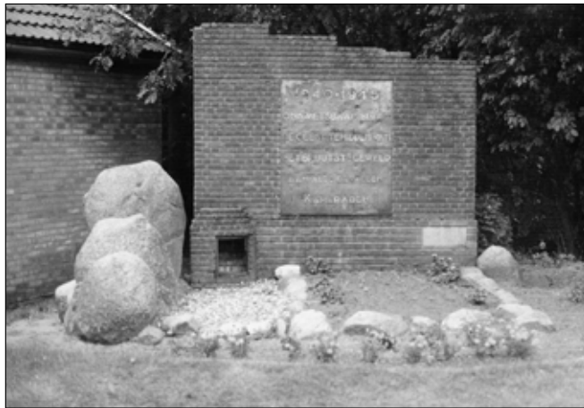
Herdenkingsmonument voor gevallen kameraden op kampeerterrein Tot Vrijheidsbezinning, Appelscha.

Diverse nummers van het anarchistische weekblad De Arbeider (1916-1937).