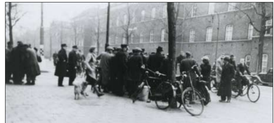
Stakende conducteurs en trambestuurders in de Sarphatistraat, 25 februari 1941

(1) Frans Boenders, De volle vrijheid , pag. 11.