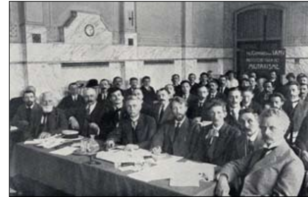
Congres van het IAMV in 1915. (Waar zijn de vrouwen?)

Pas enige jaren later zouden er nieuwe initiatieven ondernomen worden, die zich mede baseerden op de ervaringen van de (O)RVB. Zo werd in 1927 een nieuwe RSVB (verbonden aan de CPN) opgericht en het NAS startte twee jaar later een eigen Vrouwenbond, waarin